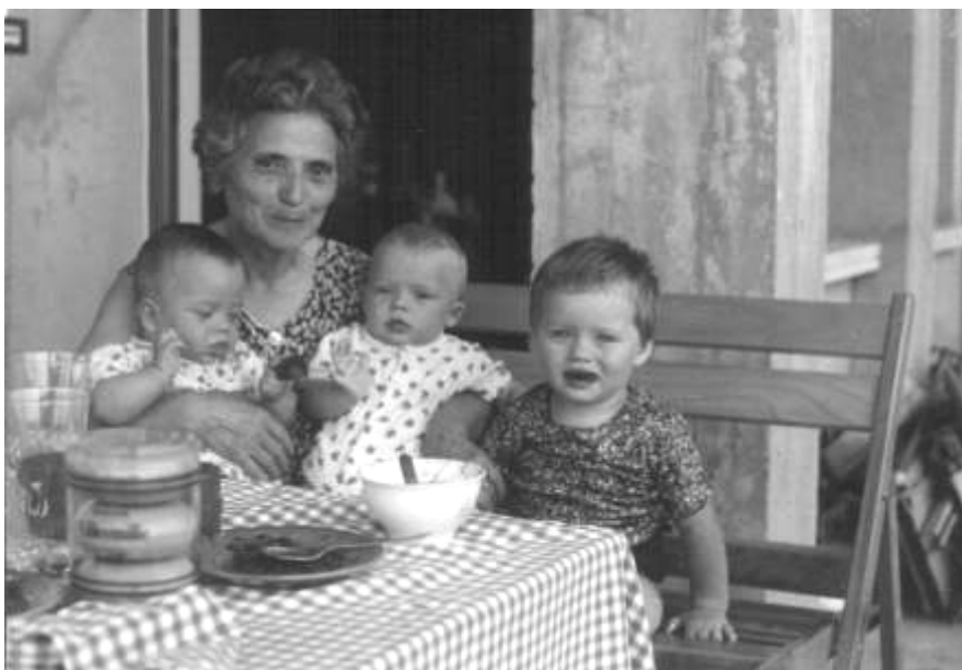
Scorcio della casa da me costruita ad Ortonovo degli ulivi , Orto del Sacomani e, sotto, mamma e i suoi unici nipoti nell'estate del 1976.